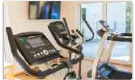
FITNESSRAUM Ganzheitliches Körpertraining