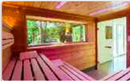
SANARIUM 65°C | Hohe Luftfeuchtigkeit