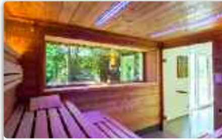
SANARIUM 65°C | High humidity