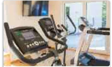
GYM All in all training