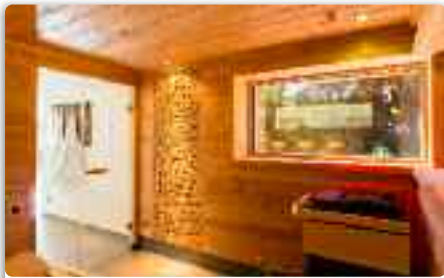
FINNISCHE SAUNA 85°C | Geringe Luftfeuchtigkeit