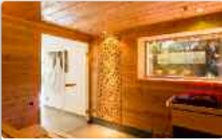
FINNISH SAUNA 85°C | Low humidity